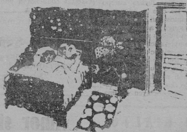
El ladrón novel.—Ustedes perdonen que les moleste. ¿Son de plata estas cucharas?