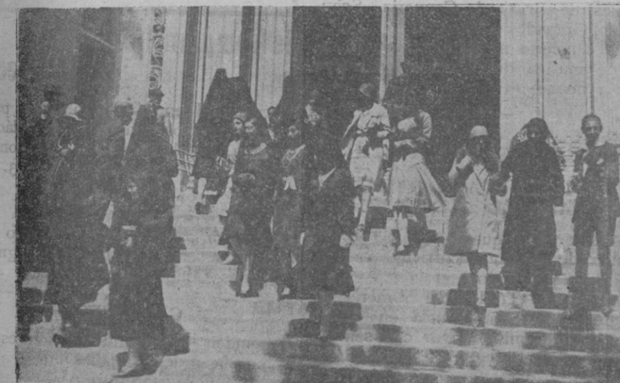
Los momentos de la visita a los Sagrarios, al mediodía del Jueves Santo