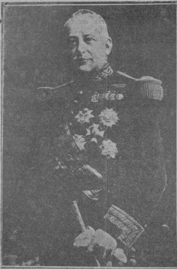
El general D. Miguel Primo de Rivera, fotografía obtenida pocos días antes de abandonar el poder