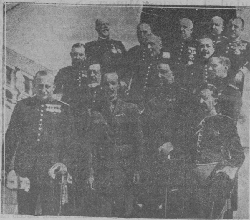
S. M. el Rey con los generales que formaron el Directorio bajo la presidencia del Marqués de Estella