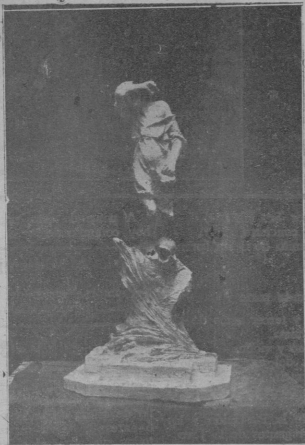
Proyecto para adorno de una de las Plazas de Palma, original del escultor señor Vila