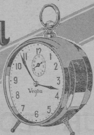
EL MEJOR DESPERTADOR

El número salió premiado, habiéndose presentado a cobrar mayor número de individuos que participaciones despachadas.