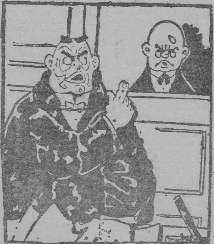
El defensor.—Cierta que el acusado contrajo matrimonio tres veces; ¿pero no es bastante castigo el solo hecho de tener tres suegras?