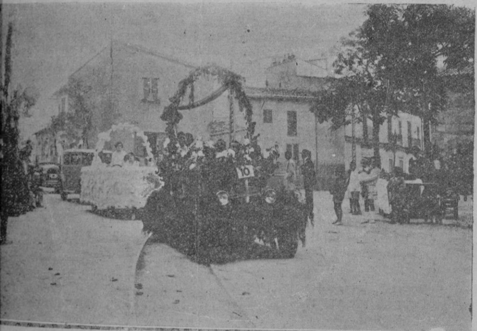
Dos de los automóviles premiados