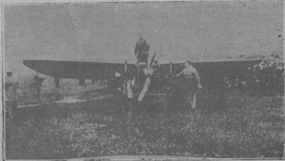
Blériot momentos antes del vuelo, el 25 de julio de 1909 para la travesía de Calais a Douvres

les amb una mansuetut i fermesa paternal i fent, per tant, impossible la guerra. Subsisteix a Ginebra per ell's, l'anestèsia dolcíssima d'aquells impressionants catorze punts d'En Wil-