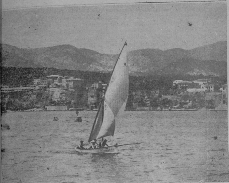
El bote «Jarda» ganador de la regata del día 21, organizada por el «Club España»