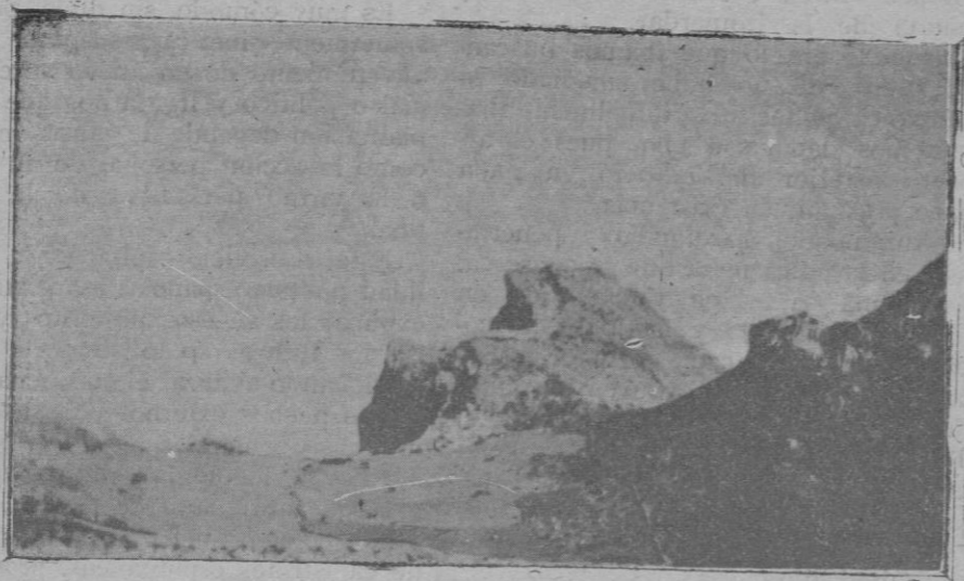
Es rafal d'Ariany

es un prestigio nacional de la ciencia médica; Marañón es un prestigio en el extranjero, donde ha sido solicitado repetidas veces para dar conferencias, a lo que ha accedido gustoso y se ha visto coronado por el éxito.