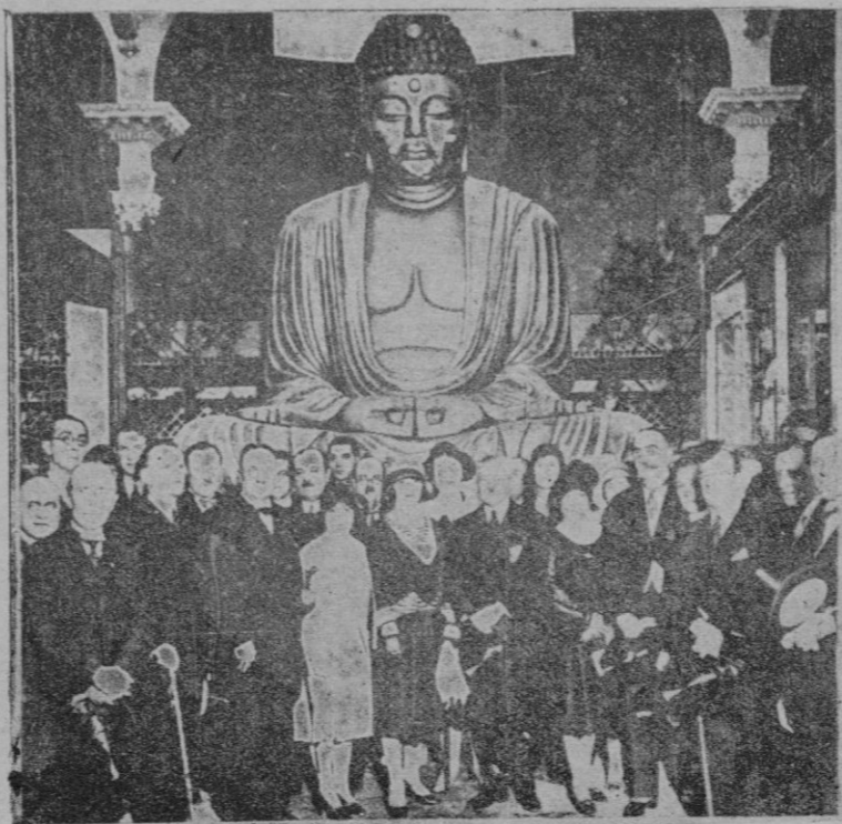
Inauguración del pabellón del Japón, en el que figura un gigantesco Budha