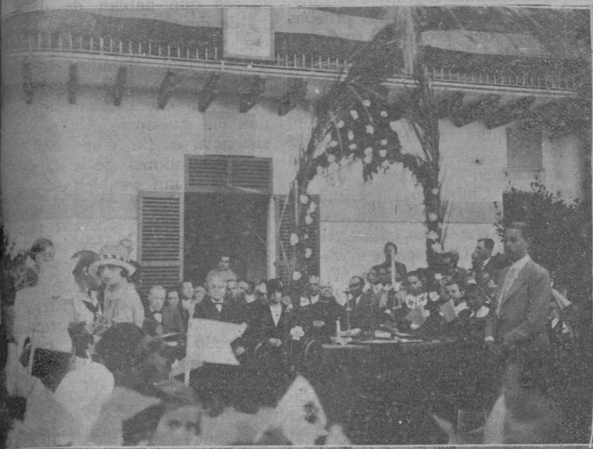
Las autoridades e invitados, en la fiesta