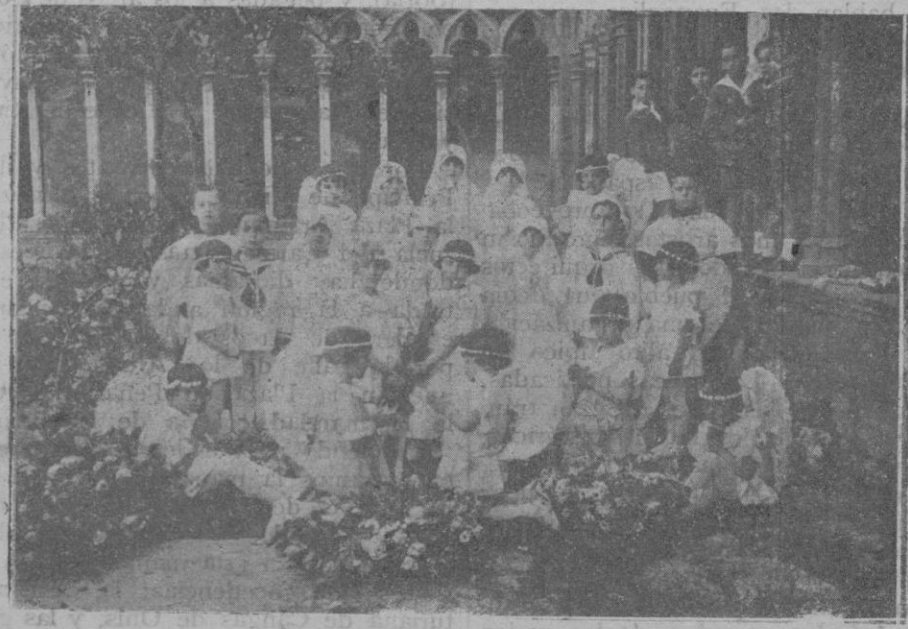
Niños y niñas, pequeños alumnos, que el domingo recibieron por primera vez el Pan de los Angeles

¡BUENA PROPAGANDA! EL ARROZ, ADMIRABLEMENTE CONDIMENTADO, SERE PARTIRA GRATUITAMENTE POR TODA ESPAÑA