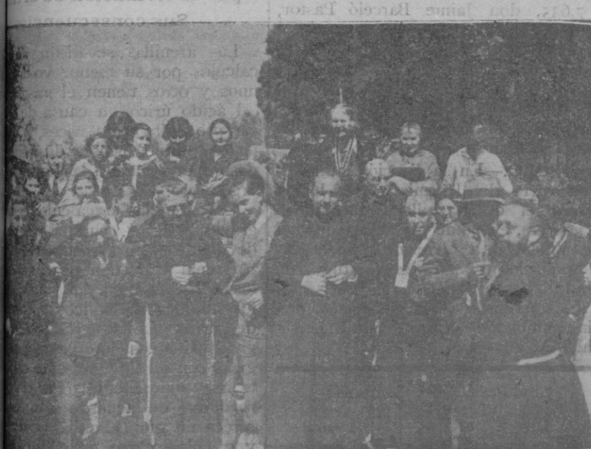
Dos grupos de peregrinos