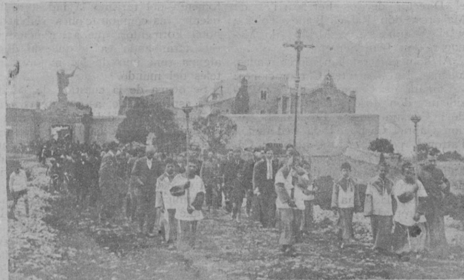
La procesión saliendo del Monasterio para bendecir los frutos del campo