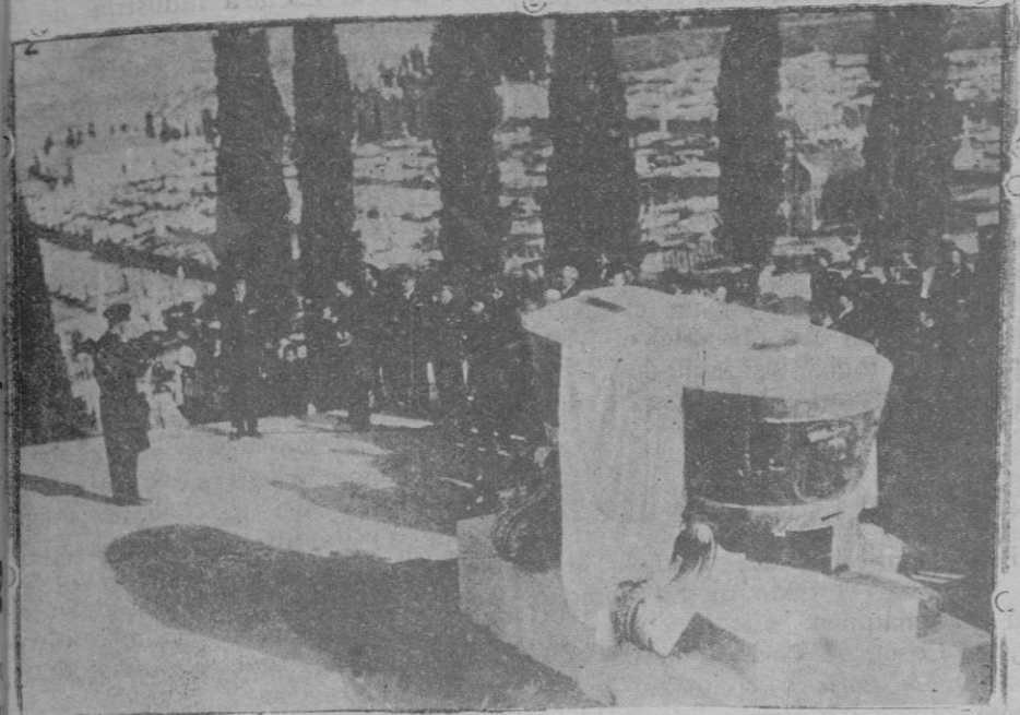
El comandante del crucero alemán «Emden», pronunciando un discurso ante la tumba del inventor del submarino, en Cartagena