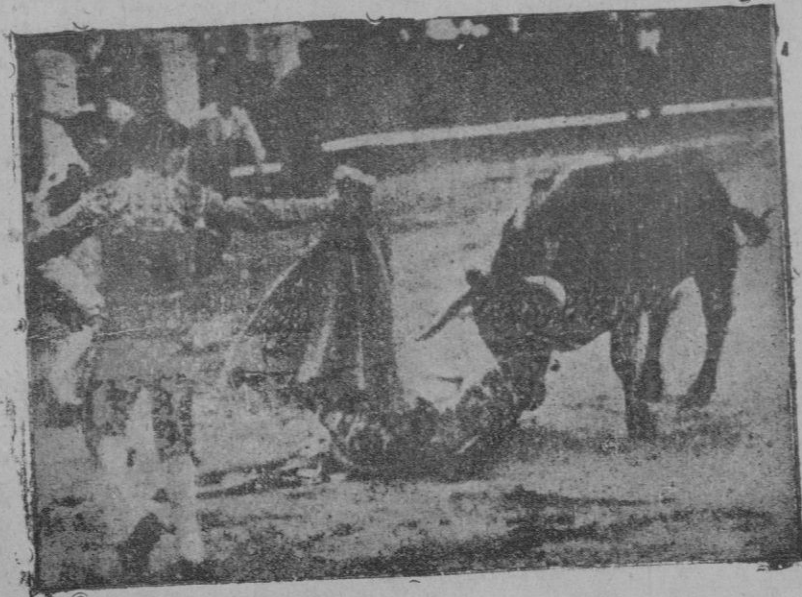
Cogida de Perlacia, en la Plaza de Toledo