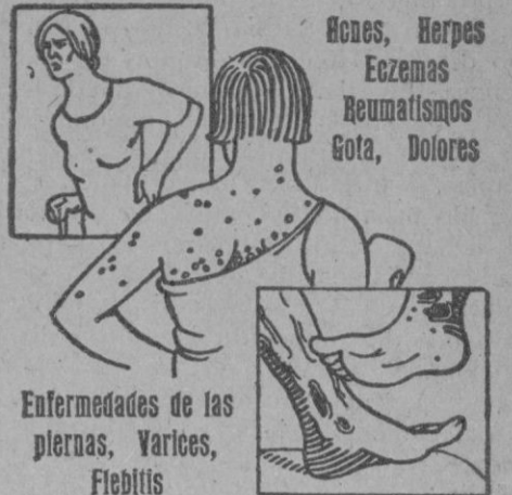
Enfermedades de las piernas, Varices, Flebitis

Henes, Herpes Eczemas Reumatismos Gota, Dolores