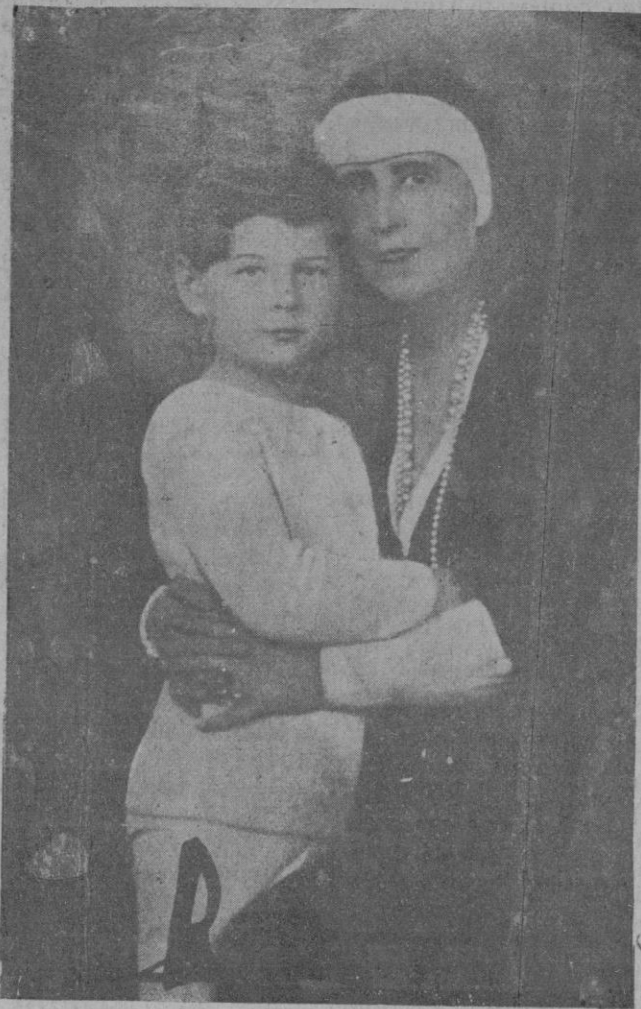
La Reina María de Rumania, que en breve visitará España, retratada con su nieto el Rey Miguel