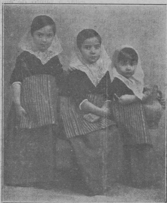
Tres lindas payesas rústicas