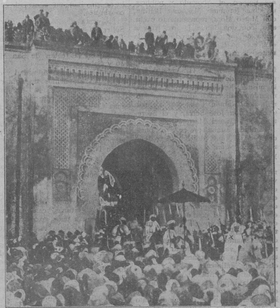
Su solemne entrada en la ciudad de Fez