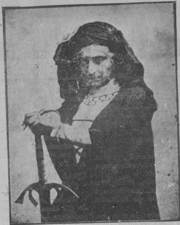
La ilustre actriz en D.ª María la Brava, obra en la que obtuvo su más grande triunfo en el escenario del Teatro Principal de Palma

CUANDO EL GENERAL INGRESO EN LA ACADEMIA MILITAR NO HABIA NACIDO NINGUNO DE LOS GENERALES QUE HAY AGTUALMENTE