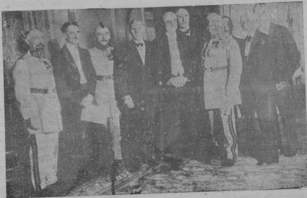
Grupo formado por el constructor Voisin, el aviador Farman (que hizo el primer vuelo), Bleriot, mariscal Franchet y Santos Dumont, reunidos en el Aero-Club de Francia con motivo del vigésimo aniversario de la aviación