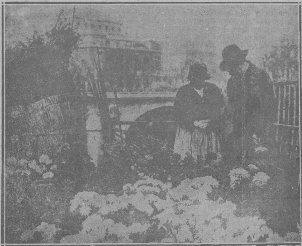
Un puesto de crisantemos en París

Parece raro que hombres de tan diferentes tendencias como los cuatro escritores nombrados coincidieran en un punto de tan grande importancia en el momento actual. Casi increíble resulta el caso de que Kipling imperialista, Wells enemigo encarnizado de imperialismos y nacionalismos, Chesterton, católico ferviente, y Shaw sin ninguna creencia conocida empeñado en hacer hombres a todos los santos, coincidieran en este punto del sufragio universal. Y, sin embargo, es así. Unos más veladamente que otros, los cuatro en una o en otra ocasión se han mostrado enemigos del sufragio universal al reconocer su inutilidad en el momento actual.