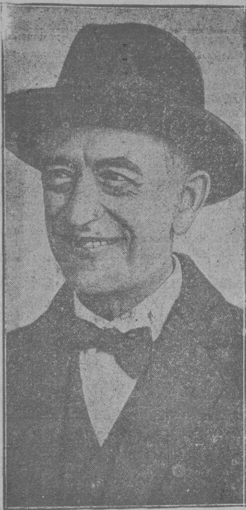
El gran compositor D. Manuel Falla, a quien se tributó ayer en Madrid un homenaje