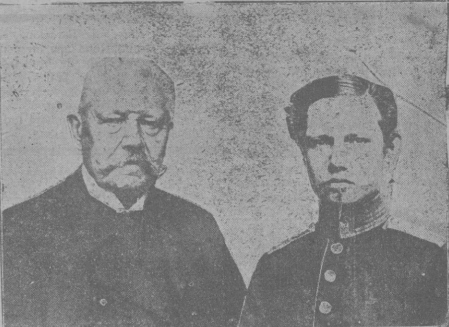
Hindenburg en la actualidad y cuando era teniente

Esto será lo que evite una nueva guerra, poco provechosa, como todas las guerras. Y en la evitación de eso que algunos consideran como inevitable, intervendrá también el desagradable recuerdo que deja toda la serie de guerras y crímenes, toda aquella lamentable serie que eligió como última vista hasta ahora al desgraciado O'Higgins.