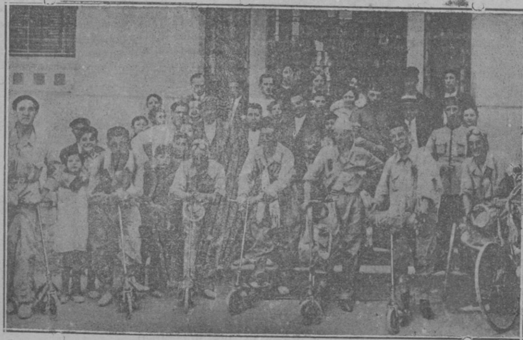
Los periodistas zaragozanos que han hecho el viaje de Zaragoza a Madrid, en patines

ción de la Sociedad de las Naciones. Su labor, a juicio del ilustre político inglés, ha de ser muy fructuosa.