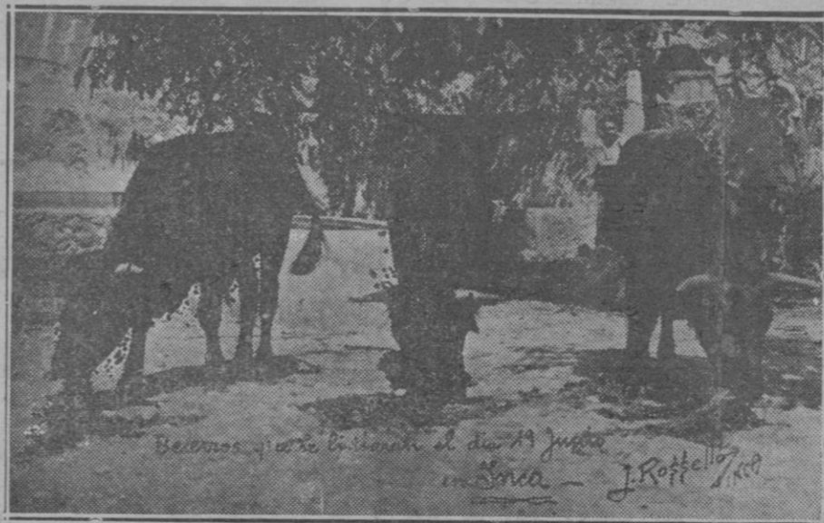
Los tres becerros que han de lidiarse el domingo en Inca