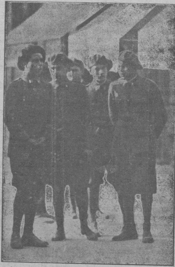
Grupo de soldados de cuota, con el nuevo uniforme, que llamaron la atención estos pasados días por las calles de Palma, por la novedad

campo y favorecida por la generosa confianza con que me honra mi Jefe inmediato, el señor Ministro de Fomento, ésta es la que más halaga mi paternidad, y puedo decirle a usted que al engendrarle de sentido ese dolor que purifica y ennoblece todas las concepciones del espíritu o de la sangre. Los que conocen el amor que siento por mi carrera podrán apreciar el dolor de mi sacrificio. Tenía en ese cargo, que debo a la bondad del Gobierno, y más especialmente, a su Presidente, centralizadas las más amplias facultades. Podía crear servicios, asignarle personal, dotarlos libremente. Pero he vivido la angustia del técnico enamorado de su carrera y aislado de la colaboración social indispensable. He visto, con sonrojo, en tiempos, por fortuna pasados, como en localidades eminentemente olivícolas, por ejemplo, se establecían cen-