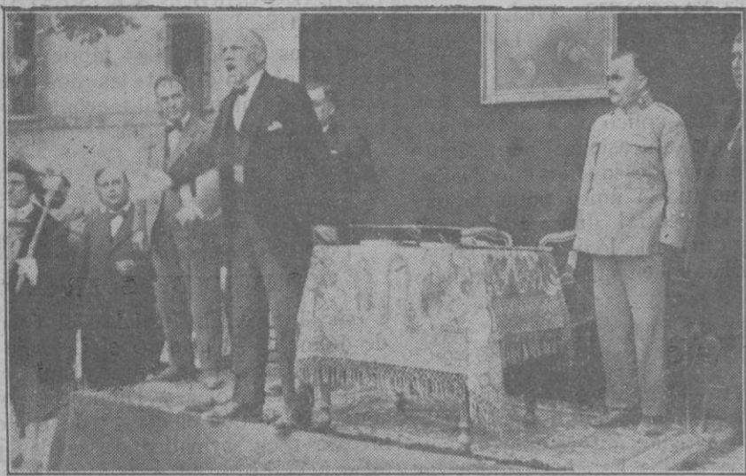
El Gobernador civil Sr. Llosas pronunciando un discurso