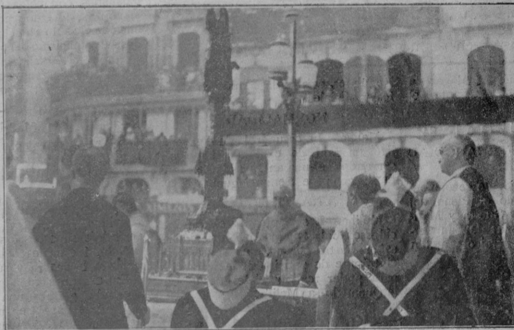
Momento de ser colocada la Custodia sobre el altar frente a la Casa Consistorial, en el que se había extendido la bandera