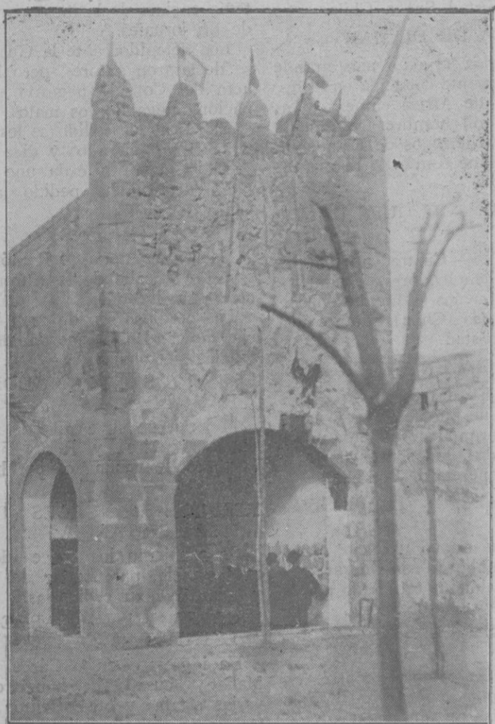
La histórica casa de «Ses Puntes» donde está instalado el Museo