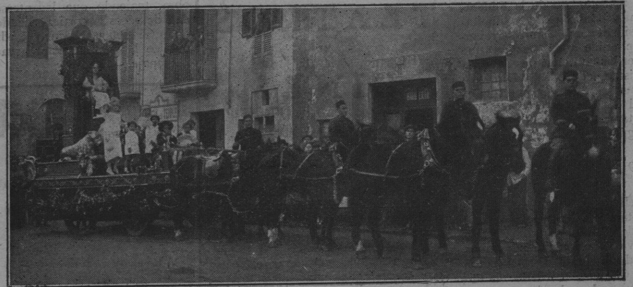
La carroza de la Asistencia Palmesana, que recorrió las calles de Palma, recogiendo donativos para el Aguinaldo del soldado.