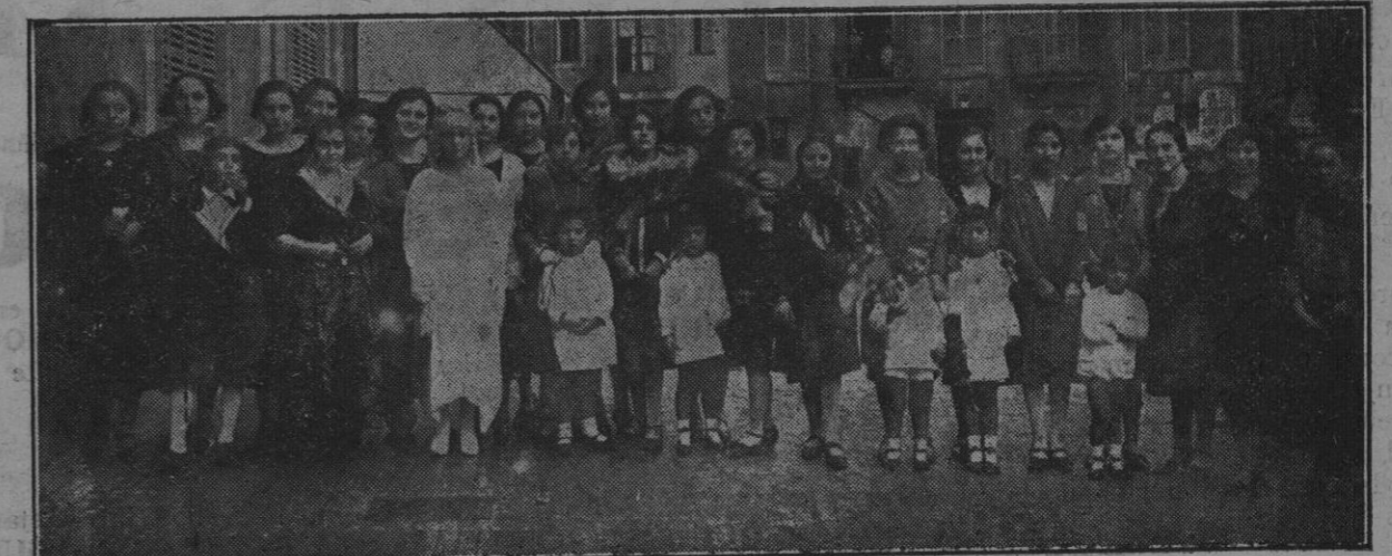
Señoritas postulantes que acompañaban a la carroza