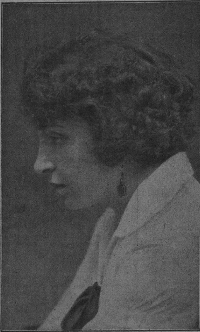
La eminente actriz Matia Bassó, primera figura de la notable compañía de comedias que ayer debutó en el Teatro Principal

se licenció en Derecho en la Univer- sidad Central.