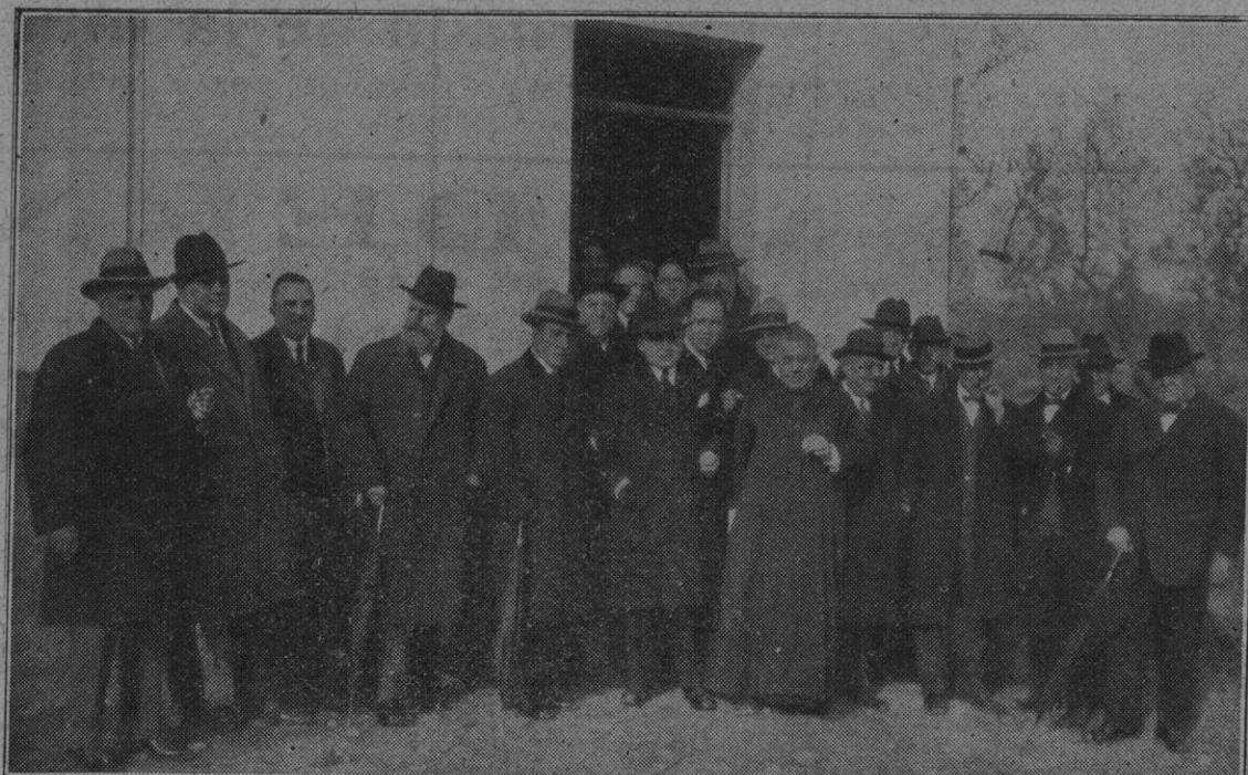
Grupo de asistentes a la bendición del chalet de la Casa Matos