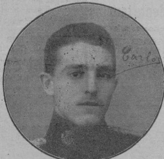
El teniente don Carlos Moysi y Vidal, muerto gloriosamente en el combate de Beni-Arós