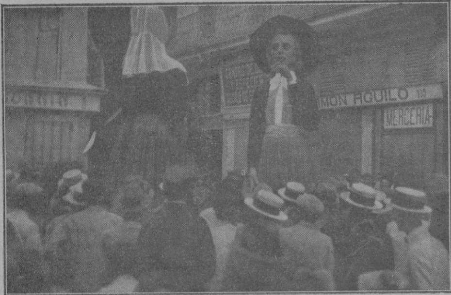
Los gigantes. Cabezas bailando por las calles de Palma