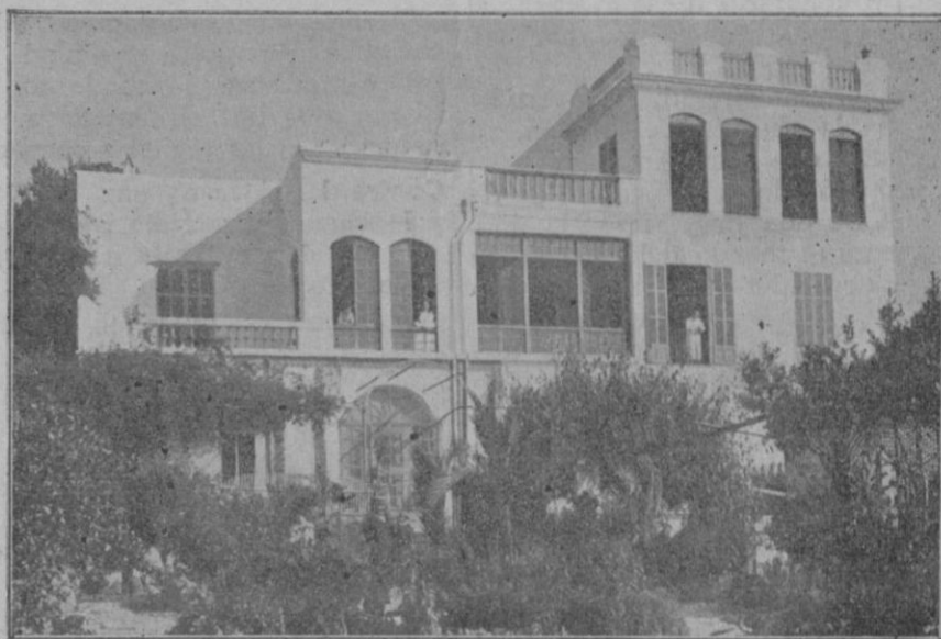
Vista de la Clínica.