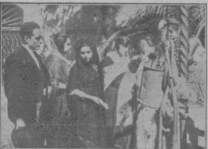
Dos momentos de la impresión de la película «Venganzas», cuyo argumento se desarrolla en Mallorca. Los artistas con los trajes de nuestras campesinas.

de Palacio el pequeño monumento erigido a la memoria del sabio pedagogo don José Quadrado.