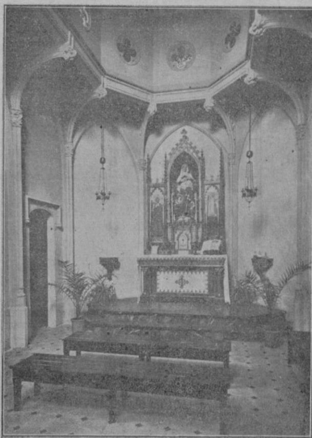
La Capilla de la Clínica.