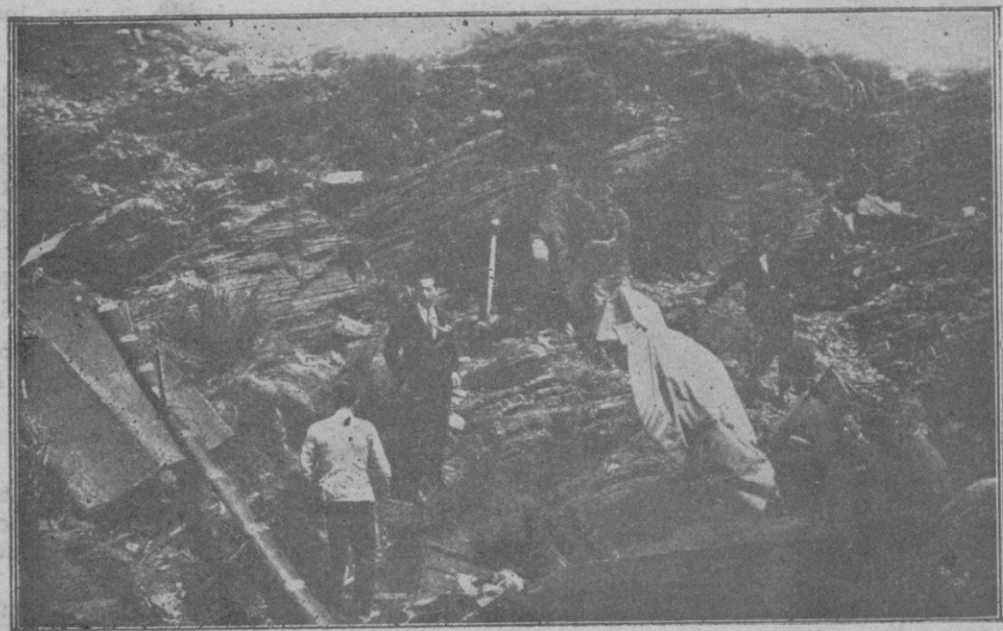
«El Freus», donde se estrelló el hidroavión de la escuadrilla española, pereciendo los dos tripulantes señores Cervera y Suarez Tangil.—Se ven los restos del hidroavión y uno de los cadáveres.