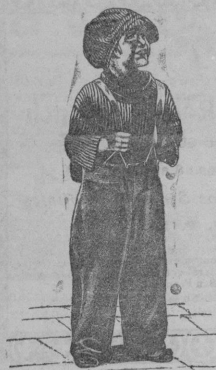
CHIQUILIN POR Jackie Coogan

Ahora se ve el corazoncito de oro de Chiquilin, tan combatido por penas, por precisamente la clave de sus mayores alegrías. Y así es el cuento.