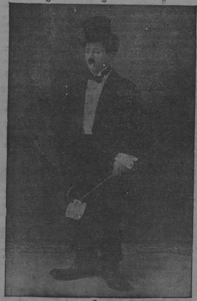
El incomparable artista Charlot, la atracción principal del Circo