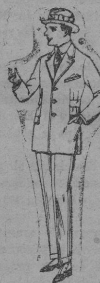
Trajes de patén, vicuña o jerga, forma Sport, para niños y jovencitos de 10 a 16 años. De ptas. 40 a 85