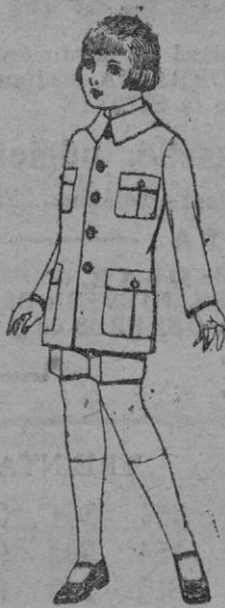
Trajes de patén modelo Sport, para niñas de 4 a 9 años. De ptas. 22 a 35