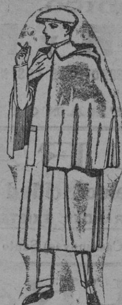
Impermeables mackerrand en negro y azul. De ptas. 85 a 175