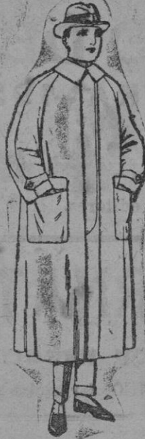
Impermeables raglán en azul y colores. De ptas. 82 a 170