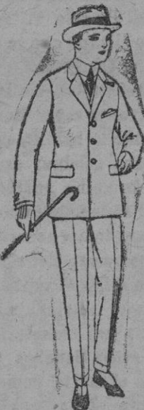
Trajes de patén, vicuña o jerga, para niños y jovencitos de 10 a 16 años. De ptas. 39 a 85