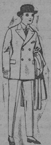
Trajes de patén, vicuña, etc., para niñas y jovencitos de 10 a 16 años. De ptas. 32 a 85