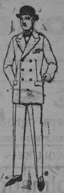
Trajes de melton, cheviot, estambre, vicuña o jerga. De ptas. 60 a 170