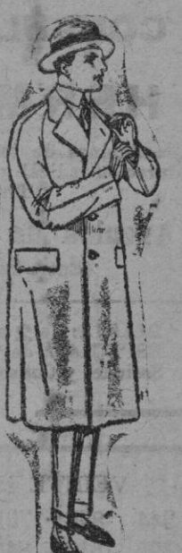
Gabanes raglán de patén, melton o cheviot, con forro seda o ratén. De ptas. 60 a 160

Ropas confeccionadas para Caballero, Señora, Niño y Niña