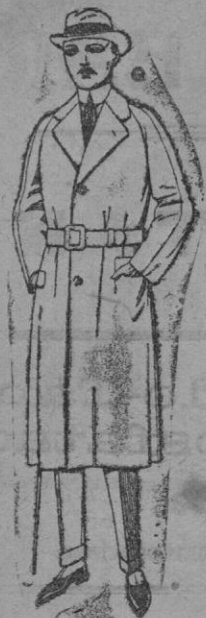
Gabanes raglán de patén, gamuza o co-wer. De ptas. 75 a 200

Madrid, Barcelona, Alicante, Almería, Bilbao, Cádiz, Cartagena, Gijón, Granada, Málaga, Santander, Sevilla, Valencia, Valladolid, Zaragoza