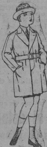
Gabanes de patén, gamuza, etc., para niños y jovencitos de 10 a 16 años. De ptas. 80 a 75