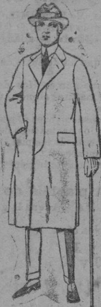
Gabanes de cheviot, gamuza o patén, etc. De ptas. 45 a 140