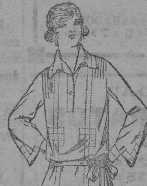
Blusas de crepón seda en negro, azul y color, adornos calados. De ptas. 80 a 65