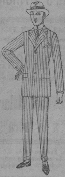
Trajes de cheviot, patén, estambre, etc. De ptas. 88 a 135

Madrid, Barcelona, Alicante, Almería, Bilbao, Cádiz, Cartagena, Gijón, Granada, Málaga, Santander, Sevilla, Valencia, Valladolid, Zaragoza