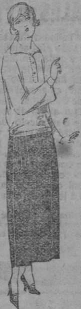
Faldas de popeline, estambre, etc., en negro, azul y color De ptas. 88 a 60