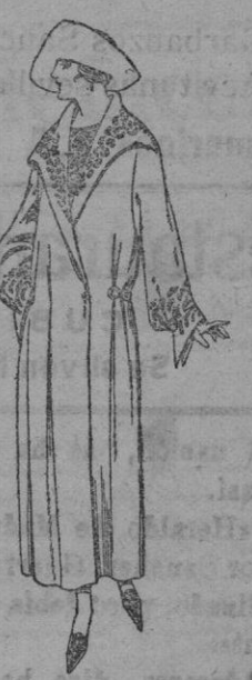
Abrigos de terciopelo de lana, gamuza pañete, etc., en negro, azul y color, adornos bordados. De ptas. 80 a 95

Ropas confeccionadas para Caballero, Señora, Niño y Niña