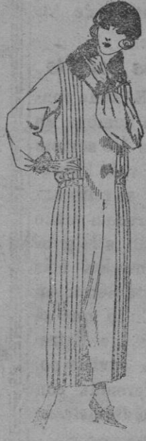
Vestidos de sarga inglesa crepé, etc., en negro, azul y color, adornos bordados. De ptas. 125 a 160