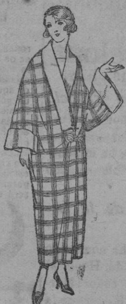
Batas de franela, dibujos novedad. De ptas. 27 a 38