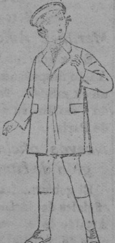
Gabanes de patén, gamuza, etc., para niños de 4 a 9 años De ptas. 26 a 50