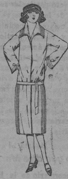
Abrigos de terciopelo de lana, gamuza, etc., en negro, azul y color para jovencitas de 12 a 15 años. De ptas. 50 a 70