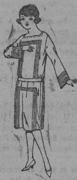
Vestidos de sarga inglesa, gabardina, etc. en azul y color, para jovencitas de 12 a 15 años. De ptas. 63 a 80