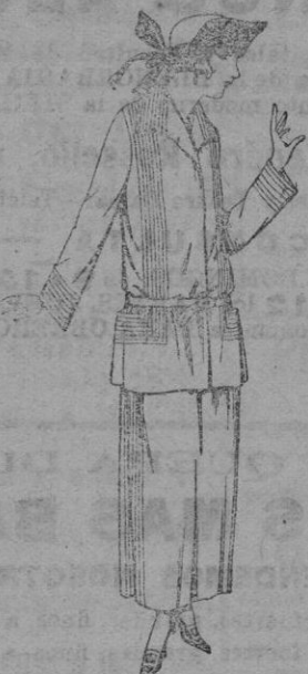
Trajes sastre, de popaline, e tambre etc., adornos pespunte seda, chaqueta forrada de seda en marino, negro y color moda De ptas. 125 a 160