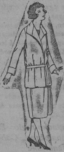
Trajes de estambre, lanilla, etc., en azul y color, para jovencitas de 12 a 15 años. De ptas. 80 a 100