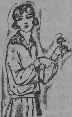
Blusas de punto de seda diferentes colores, adornos bordados. De ptas. 55 a 75