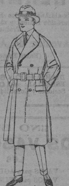
Gabanes cruzados de cheviot, cower o pluma. De ptas. 95 a 185