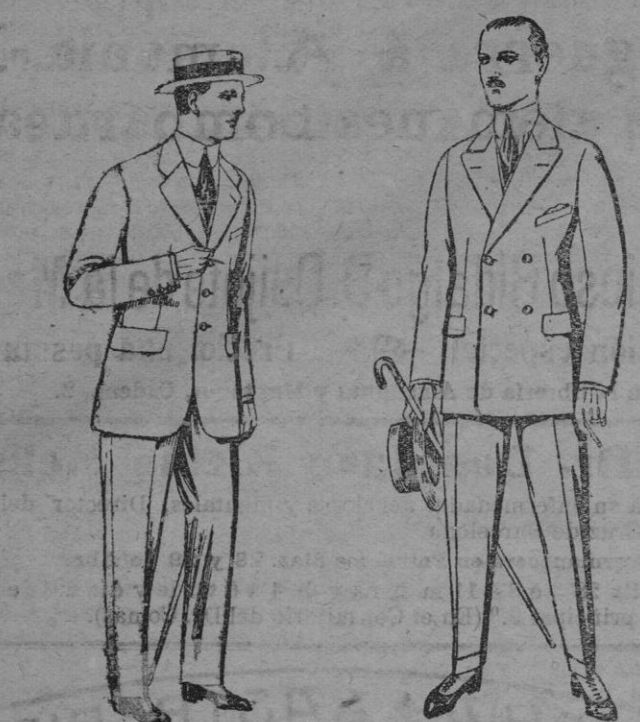
Trajes lanilla melton, etc. De ptas. 20 á 80 Trajes de vicuña ó jerga negros ó azules. De ptas. 38 á 80 Los mismos en melton ó estambre novedad. De ptas. 33 á 90