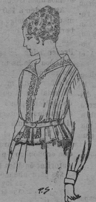
Blusa de voile blanco, bordados blanco, rosa ó azul. A ptas. 9