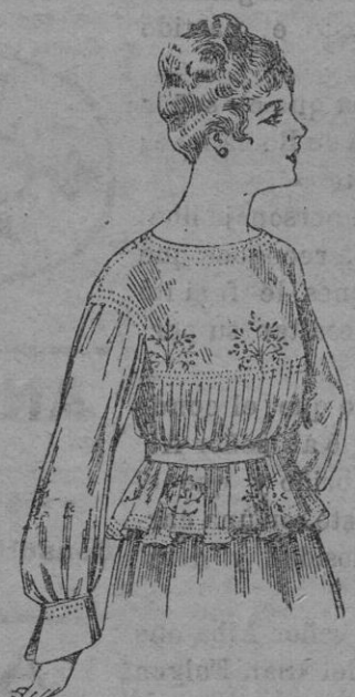
Blusa de crepón ó seda, en negro, azul, y color. A ptas. 33