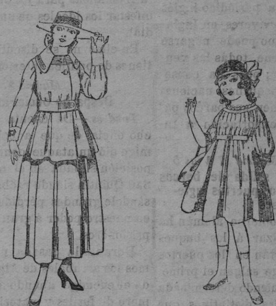
Trajes de lanilla negra, azul y color, para jovencitas de 13 á 16 años. De ptas. 50 á 55 Vestidos de lanilla azul, para niñas de 4 á 9 años. De ptas. 22 á 25 Los mismos en voile. De ptas. 10 á 17

Gorras, Sombreros de paja, Calcetines, Corbatas, Fajas, Ligas, Tirantes, Pañuelos, etc.