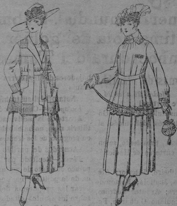
Trajes de lanilla negra, azul y color, bordado. A ptas. 90 Trajes de estambre negro, azul y color, bordado. De ptas. 90 á 93