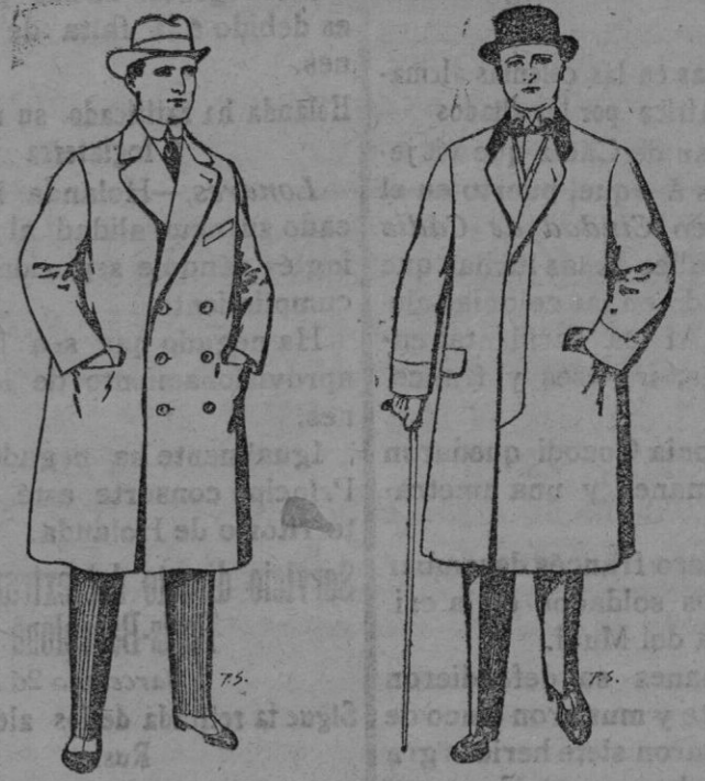
Gabanes de paten y cheviot. De Ptas. 55 á 105 Gabanes de paten, mel tón y cheviot. De Ptas. 25 á 100