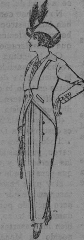
Traje jerga negra para Señora. Ptas. 65

Gorras, Sombreros, Cinturones, Calcetines, Corbatas, Fajas, Ligas, Tirantes, etc., etc.