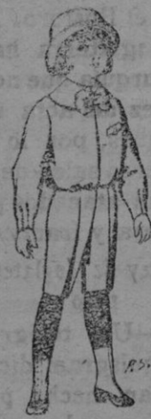
Trajes paten para niños de 4 á 9 años. De Ptas. 5 á 5'50