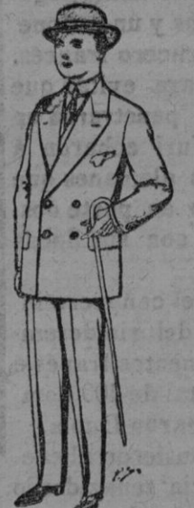
Trajes de paten vicuña etc. para niños de 10 á 16 años. De Ptas. 25 á 48