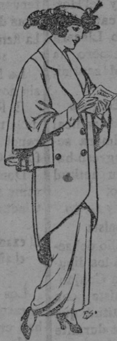
Abrigos de paten para Señora. De Ptas. 55 á 65

Ropas Confeccionadas para Caballero, Señora, Niño y Niña