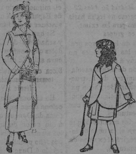
Trajes de lanilla para jovencitas de 13 á 16 años. De Ptas. 40 á 45 Trajes de lanilla para niñas de 4 á 12 años. De Ptas. 14 á 22