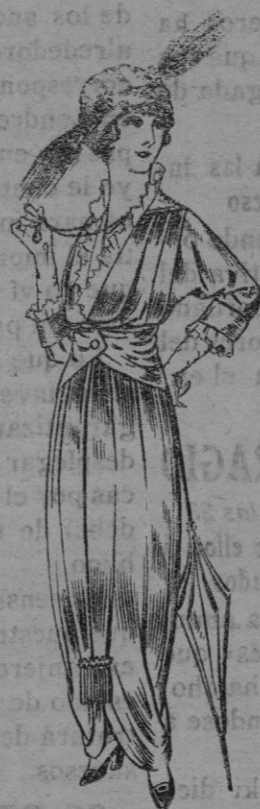
Vestido de seda negra ó azul para Señora De Ptas. 35 á 73

Gorras, Sombreros de paja, Cinturones, Calcetines, Corbatas Fajas, Ligas, Tirantes, etc., etc.