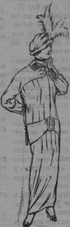
Traje de jerga azul ó negra y géneros novedad para Sra. á Ptas. 50 y 55

Ropas Confeccionadas para Caballero, Señora Niño y Niña.