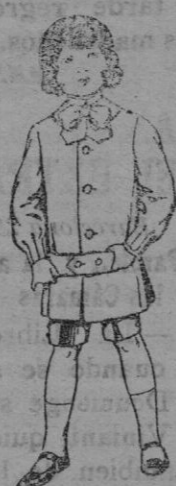
Trajes de lanilla para niños de 4 á 9 años. De Ptas. 9 á 22