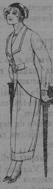
Trajes de lanilla para jovencitas de 13 á 16 años. De Ptas. 13 á 15