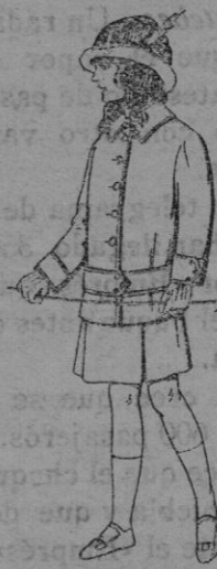
Trajes de lanilla para niñas de 4 á 12 años. De Ptas. 13 á 15