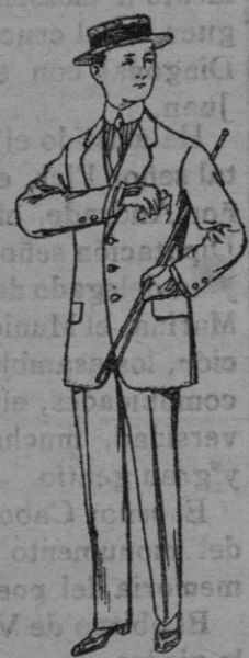
Trajes de estambre, vicuña ó jerga para niños de 10 á 16 años. De Ptas. 17 á 48