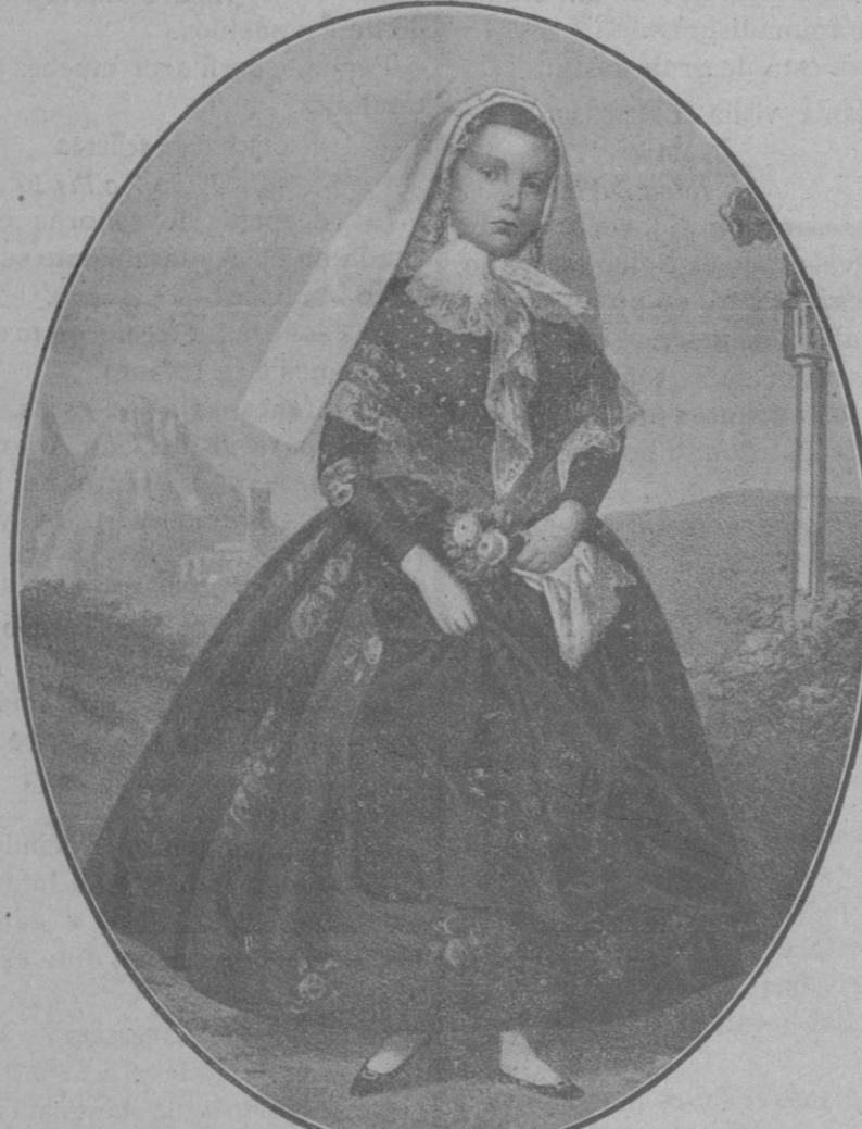
La Infanta en 1860, luciendo el traje de payesa mallorquina, no habiéndonos sido posible obtener ninguna fotografía ó estampa de ella, por lo que la publicamos en traje de catalana, estampa hecha á raíz de su excursión con su madre la Reina Isabel por Baleares y Cataluña.

Para el alma andariega, para el cultivado y artístico espíritu de la Infanta Isabel fueron sin duda estas evocaciones de su primer viaje á Mallorca, allá en la edad que se siente, sin ana-