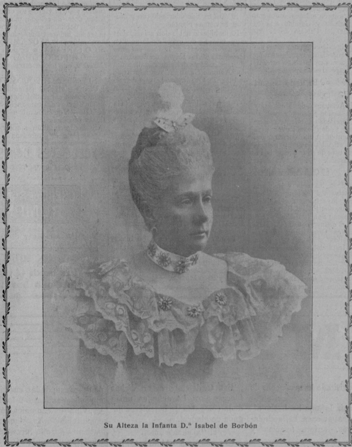
Su Alteza la Infanta D.ª Isabel de Borbón