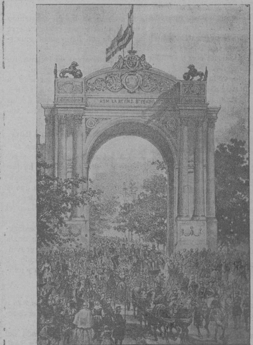
Recuerdo de la primera visita de la Infanta Isabel á Palma.—La comitiva regia, entrando en la ciudad bajo el arco levantado á la entrada del paseo del Borne.