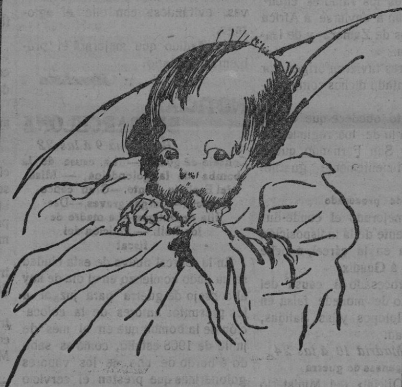
Ahora viene mi leche con GLIDINE