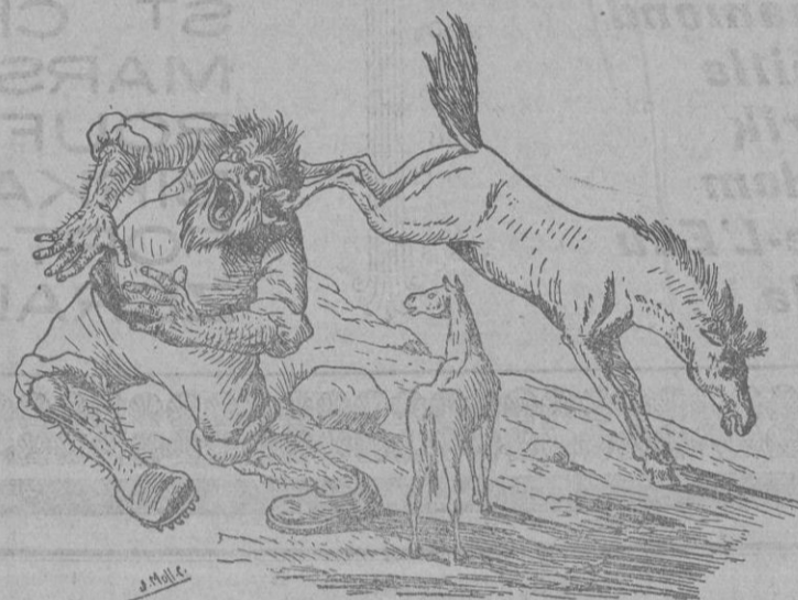
S'ego li entaferra cosa...

Aquí es gigant, tot amatent, s'acosta a s'ego, li mira sa pota endreta de darrera per treureli s'esterranch; y a les hores s'ego li entaferra cosa, però ben a ferir.