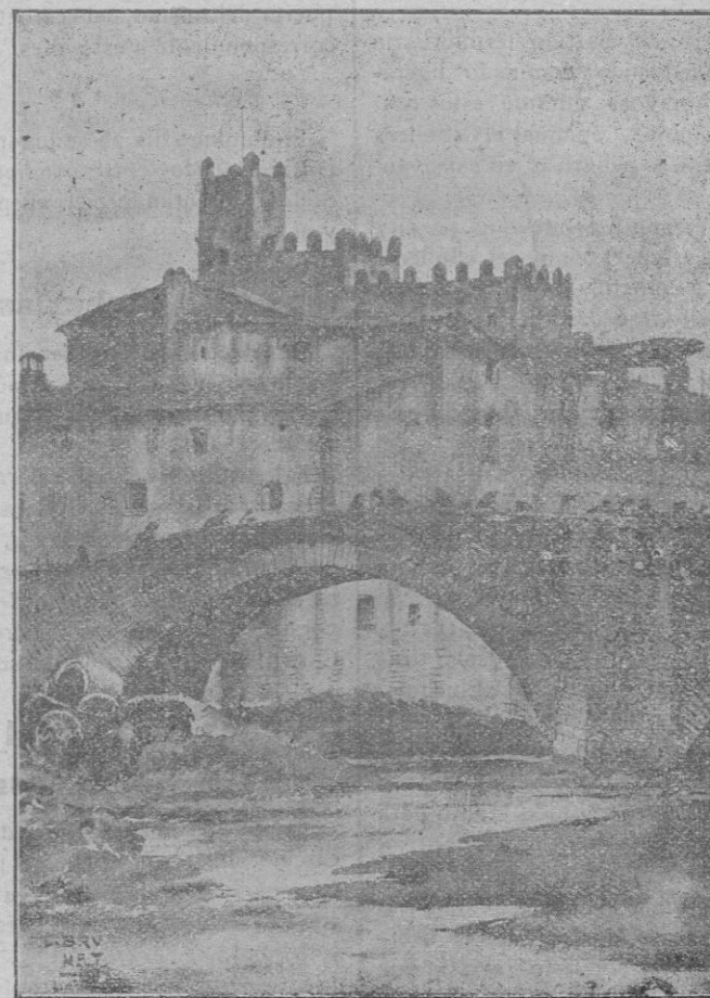
El puente viejo y el Castillo de La Bisbal (Gerona)

(Estudio del natural por Lorenzo Brunet)