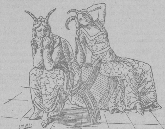
Y de banyons tornaren banyes com ses d'un boch