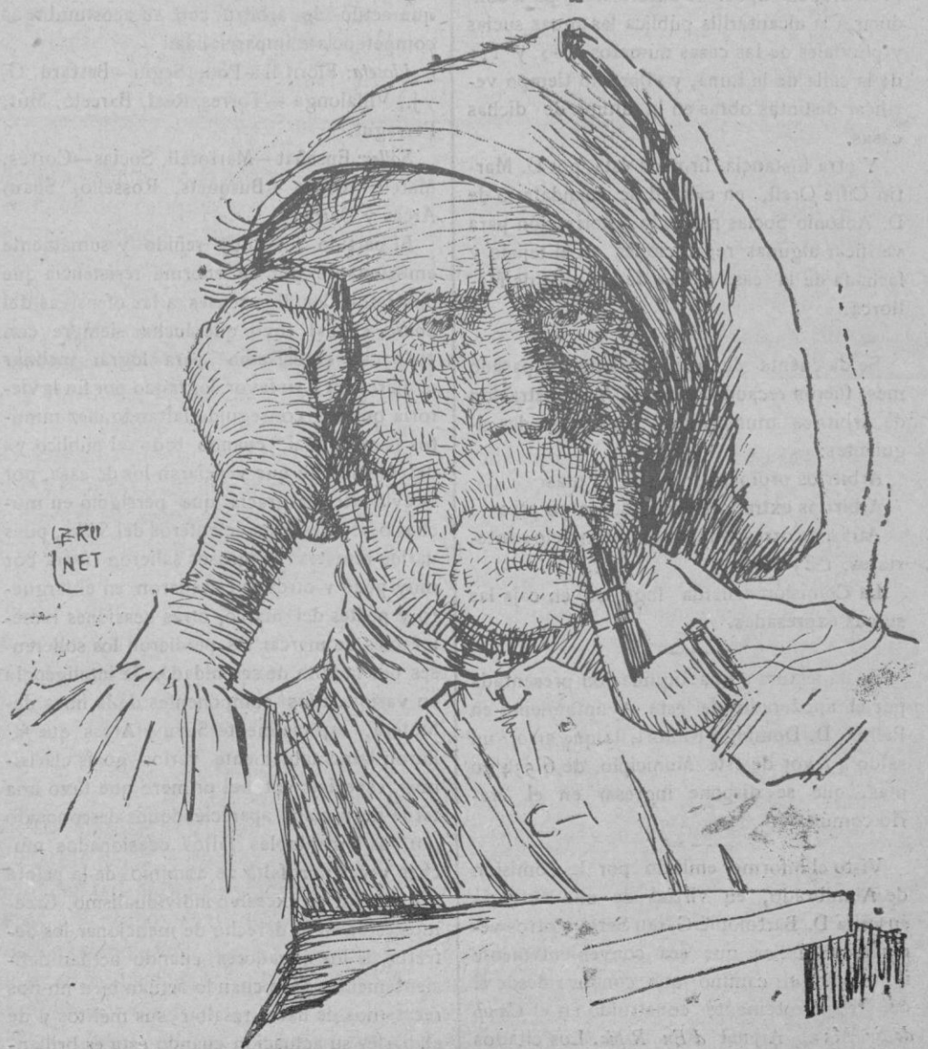
"EN GROS" — Pastor del Pirineo.