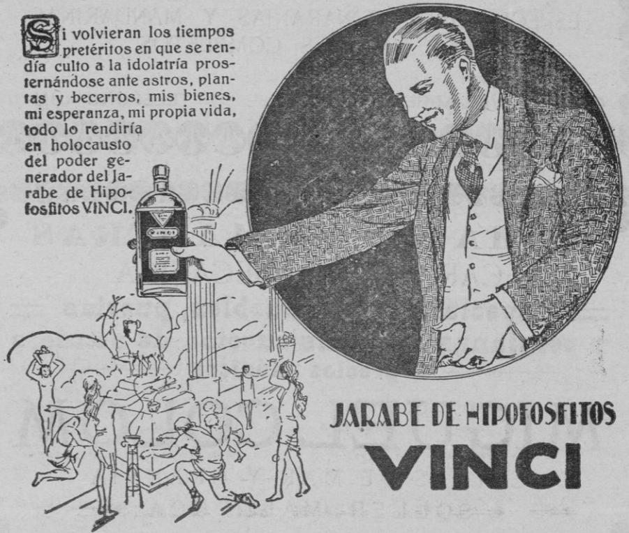
JARABE DE HIPOFOSFITOS VINCI

Si volvieran los tiempos pretéritos en que se rendía culto a la idolatría prosternándose ante astros, plantas y becerros, mis bienes, mi esperanza, mi propia vida, todo lo rendiría en holocausto del poder generador del Jarabe de Hipofosfitos VINCI.