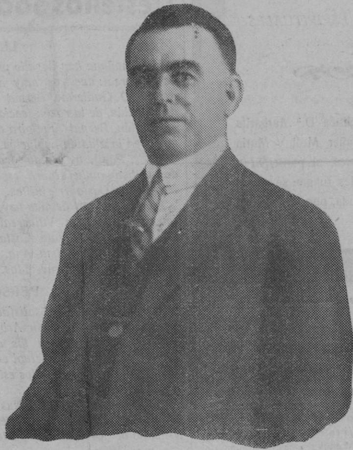
Nuestro Alcalde D. Miguel Casanovas Castañer