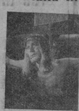
Antonio Vilar en un momento de su actuación.

Es un hecho ya comprobado que el éxito de un actor no radica precisamente en su físico atractivo, sino, y de una manera primordial en las dotes de artista que lleva aforadas. Este debe transmitir al espectador la vida y emociones del personaje que interpreta. Ha de hacer vivir al público los problemas y vicisitudes del ser que está encarnando, y llevar hasta el auditorio todo el dolor de su