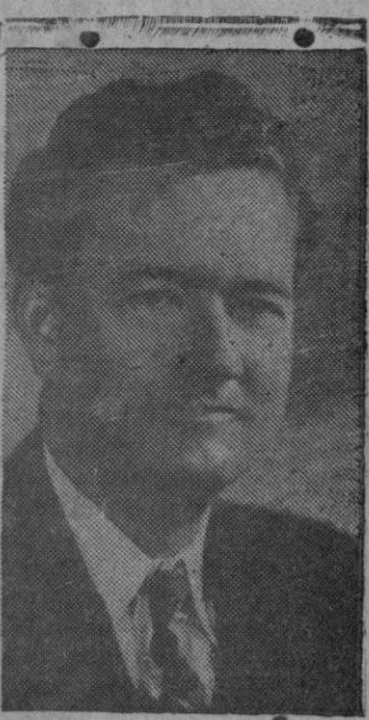
CANDIDATO DEMOCRATA A LA VICEPRESIDENCIA John J. Sparkman, Senador por Alabama, ha sido designado Candidato Nacional Demócrata a la Vicepresidencia de los Estados Unidos por la Convención recientemente celebrada en Chicago.

Con objeto de facilitar la asistencia a estos cursos de aquellos aspirantes intelectualmente dotados y con vocación probada que sean merecedores de ayuda económica (Continúa en segunda)