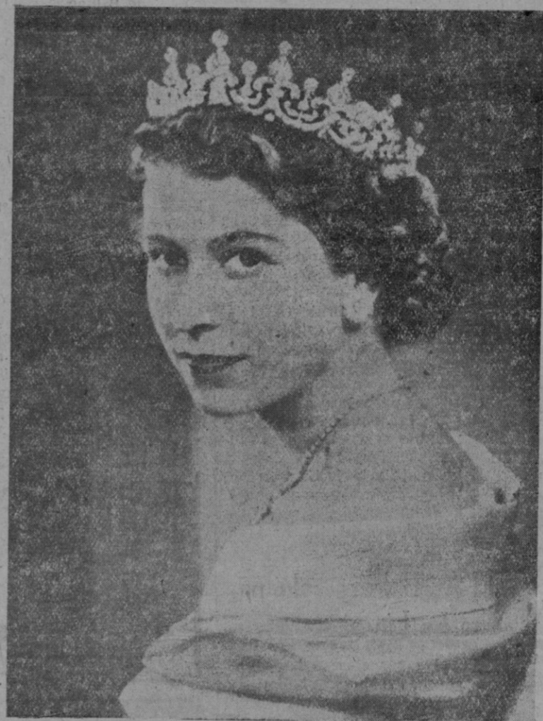
ISABEL II REINA DE INGLATERRA

O-10, 7. — Los equipos alímpicos de Rumania y Polonia, que se negaron ayer a arriar sus banderas a media asta en señal de duelo por