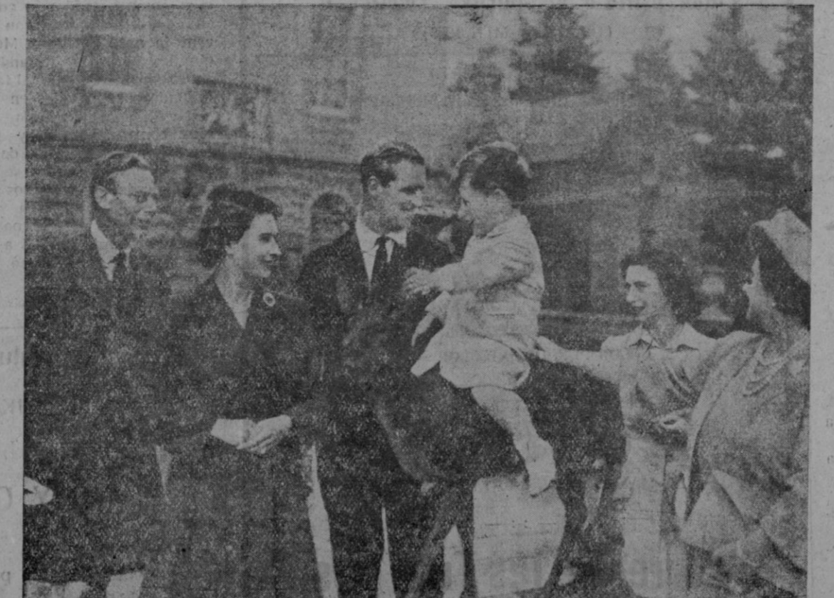
Un aspecto íntimo de la familia real británica, reunida en Palmoral aparecen en la foto el difunto Rey Jorge y su esposa; la nueva Reina Isabel con su esposo y su hijo el nuevo Príncipe de Gales y la Princesa Margarita

CHURCHILL NO IRA Londres. — El Primer Ministro Winston Churchill, sustituido en la reunión de la NATO que próximamente se celebrará en esta capital, por otro miembro de su gobierno. Se dice que la decisión ha sido tomada a causa del fallecimiento del rey Jorge VI. — Efe.