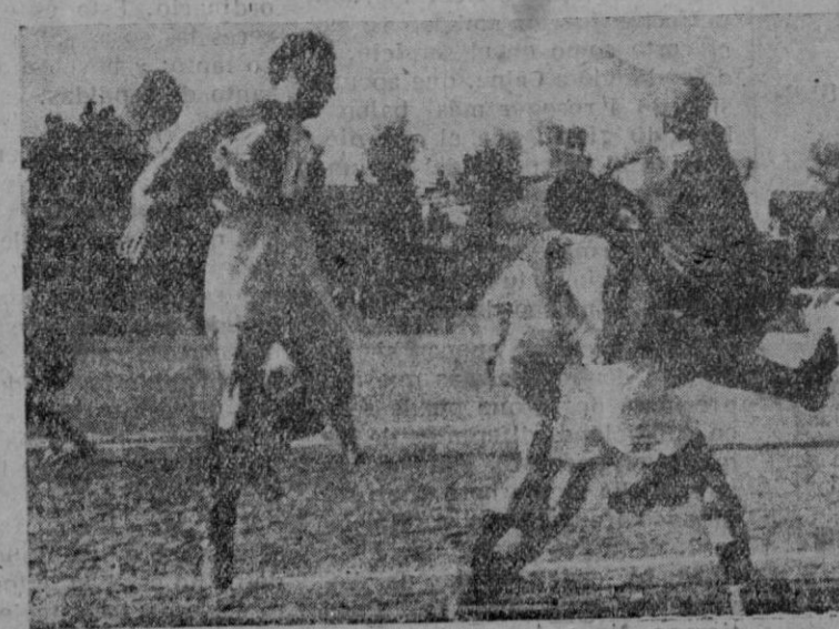
Dos momentos del partido jugado entre el "Hércules" y el "Atletico Baleares"