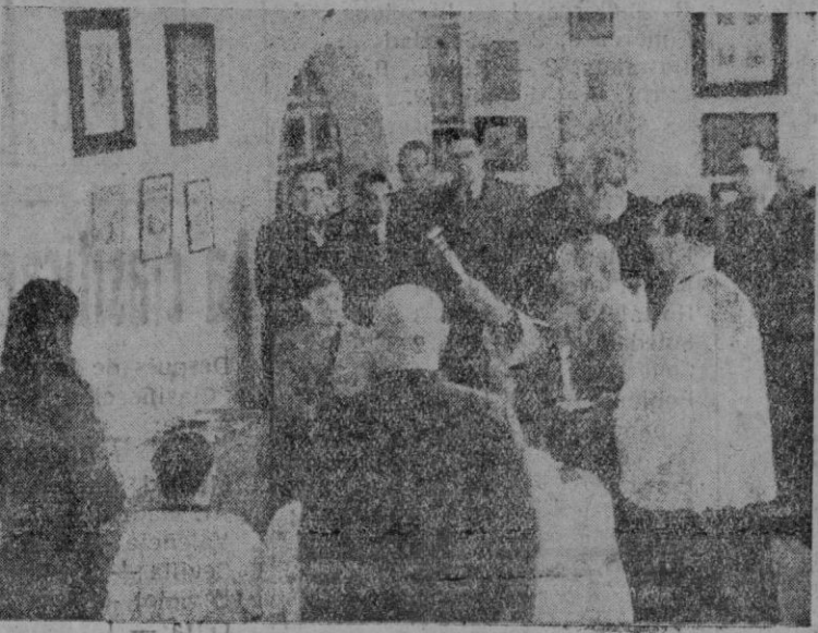
Una vista del Monumento a Ramón Lull en el momento de ser bendecido éste y otra foto en la que se ve el momento solemne de descubrir el pergamino. (Reportajes Palma)

agradecimiento en su propio Testamento, donde dejó consignado: "Legó Monasterio Beatae Mariae de Regali unum cõffre meum cum libris qui ibi sunt". Este Monumento señalará junto con el hecho positivo de la vitalidad de la Escuela Lulista, la profunda gratitud del "Lulismo" hacia el Cister y su histórico Monasterio, constituyendo un documento perenne de recordación. La "Escuela" ha querido que el descubrimiento de este Monumento lleve consigo el recuerdo de las primigenias cátedras lulistas universitarias, solicitando que lo apadrinen aquellas dos Casas que dieron a la Historia del Lulismo dos Fundadoras egregias: Inés Pachs de Quint y Beatriz de Pinós, en los albores del Renacimiento, de las que son hoy representantes respectivamente, el Muy Noble señor don José Quint-Zaforteza y Amat, y mi Padre; este como descendiente de la Casa de Condal en el Pirineo aragonés y de don Juan de Bardaxi, Camarlingo de Alfonso V "el Magnífico", y de su mujer doña Beatriz de Pinós. Con consentimiento de mi padre asisto en nombre de los míos apadrinando este acto histórico; lo hago con gran emoción, porque sé bien la fidelidad que los míos guardan a las tradiciones de la Estirpe; porque sé bien las tradiciones familiares son bellas en sí, son sagradas, son agradables al corazón y a Dios; y porque sé, también, cuanto debe pesar en los descendientes la ejemplaridad atávica de todo hecho glorioso.