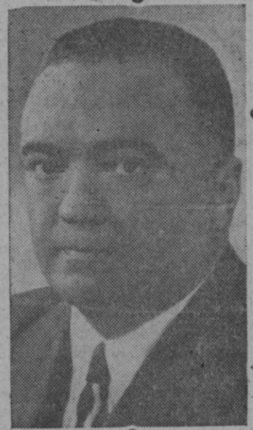
MR. JOHN EDGAR HOOVER, DIRECTOR DEL FEDERAL BUREAU OF INVESTIGATION, DEPARTAMENTO DE JUSTICIA DE LOS ESTADOS UNIDOS.

Quisieramos equivocarnos. Pero, ¿apuesta algo el lector, a que oiremos hablar de todo esto?