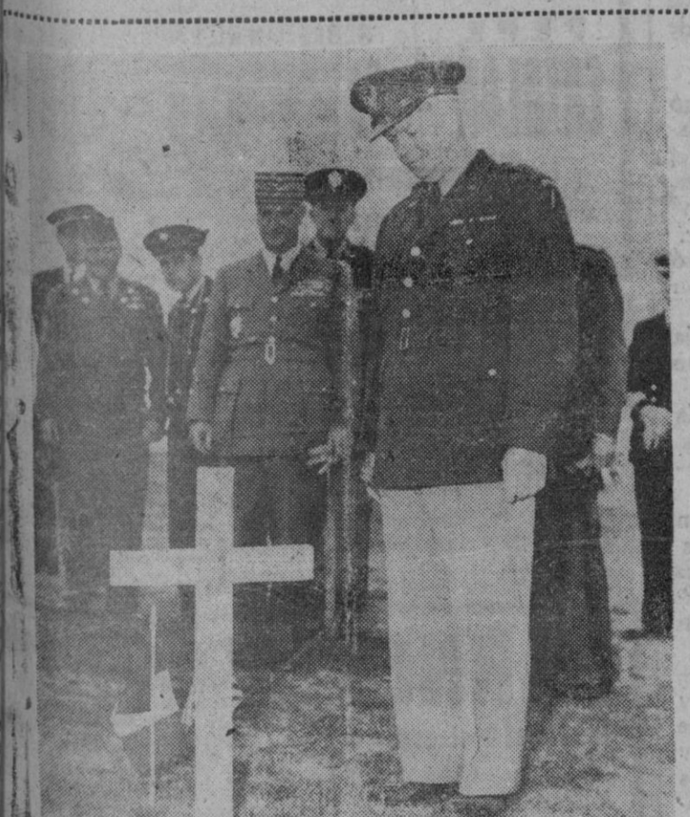
Con motivo del 7.º aniversario del desembarco aliado en Normandía en Junio, el general Dwight D. Eisenhower, actualmente Comandante Supremo Aliado en Europa, se trasladó a la cabeza de puente de la playa de Normandía para tributar un recuerdo a la memoria de los soldados aliados caídos durante el desembarco. Con profundo respeto se cuadra ante la cruz que señala la tumba de un soldado americano caído en aquella acción guerrera.

mente opuestos de EE. UU. y Gran Bretaña sobre la participación española en la defensa de Europa, representan otro obstáculo en las relaciones anglo-norteamericanas, en un momento en que esas relaciones están sujetas a intensa presión en el Iran, Corea y otros muchos puntos del mundo. Sin embargo, el Gobierno británico ha tomado la dirección en Europa de la oposición a las propuestas norteamericanas de inclusión de España en alguna manera en la defensa occidental.—Efe.